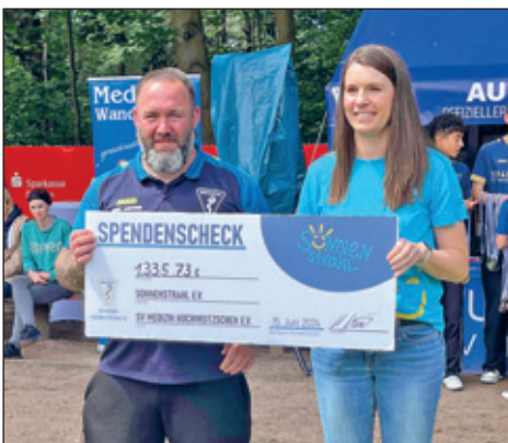
Scheckübergabe Spendenturnier an Sonnenstrahl e.V. für krebskranke Kinder & Jugendliche